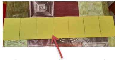
Markierung, am besten mit Bleistift

Markiert euch 7 Felder. Jeweils ein Feld hat die Maße 11x15,3cm.